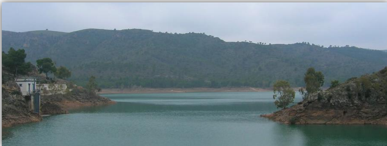
Embalse del Talave.

De nuevo en esta XIV Ruta del Roche vamos a partir de la Presa de Talave, una ruta repetida de alguna edición anterior, para recorrer la margen derecha del río Mundo hasta Liétor. Este río Mundo, afluente del Segura, nace en Los Chorros, en una espectacular cascada de unos ochenta metros, a unos 1.075 metros de altitud sobre el nivel del mar, mientras que en esta presa de Talave, tras realizar un recorrido de unos 75 kilómetros, se encuentra a una altitud de 472 metros sobre el nivel del mar.