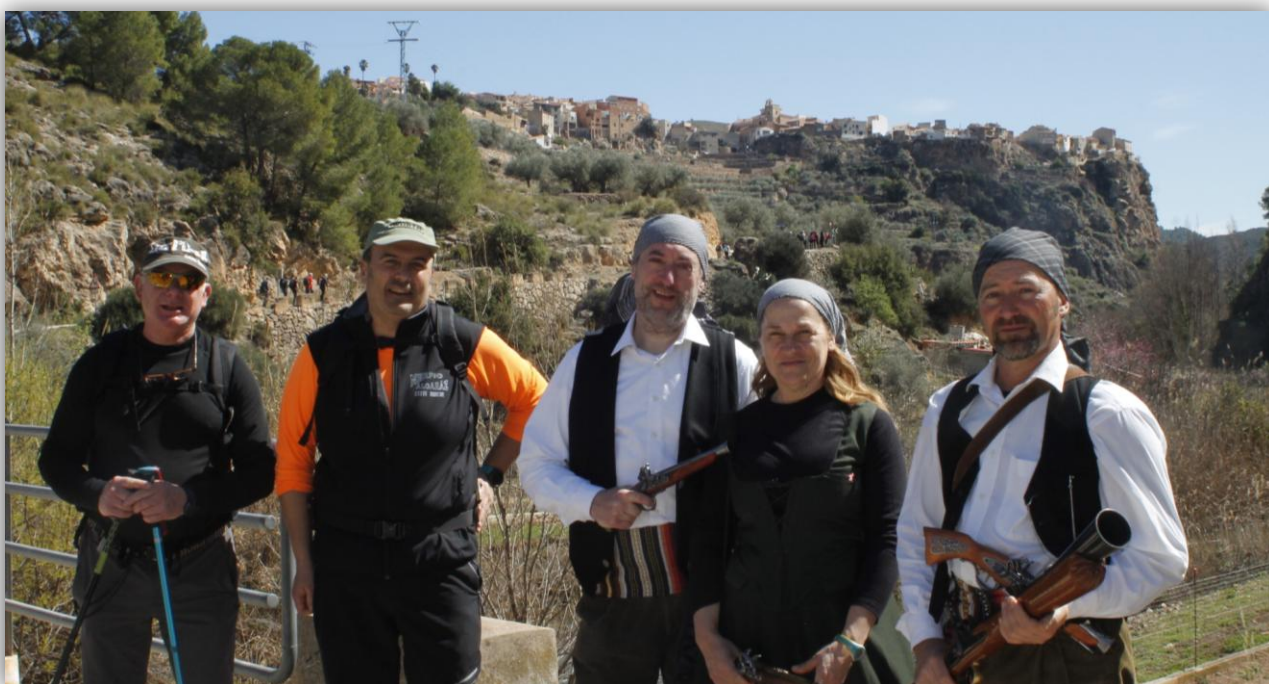
Ruta del Roche 2022.

Desde la ermita de Santa Bárbara hasta el embalse del Talave hay poco más de diez kilómetros, algo más de catorce desde Liétor, que realizaremos en sentido inverso, dejando atrás las casas de los Majales, de la Huerta y la de Capellanía. Al llegar a Liétor celebraremos un ágape en el bar La Parra, a base de patatas asadas al horno de leña con ajo aceite, atascaburras, torreznos y pisto manchego. El plato principal será la caldereta de cordero, que será coronado con un flan casero finiquitado en horno de leña. Tras el homenaje gastronómico visitaremos los templos de la población, en los que se guardan auténticos tesoros artísticos, sus casas solariegas y sus miradores, por donde esta población se asoma al Mundo.